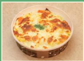
シーフードグラタン 1,000円 (税別)

営業時間 10:00~19:00 (L.O.18:30) ※テイクアウト受付 18:00 まで ホテルの庭園を望む開放感あふれるカフェ「ヴェール・フィユ」では スイーツやお飲み物の他にもテイクアウトメニューをご用意しております。