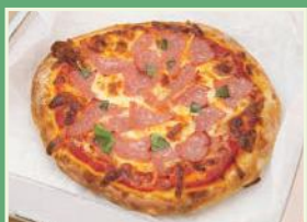
自家製生地オリジナルピザ(φ23cm) 1,400円 (税別)