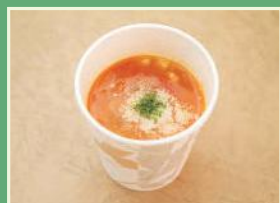
ミネストローネ 650円 (税別)

消費税 8% (店内ご飲食の場合 10%) / 電話注文優先 / 調理時間の目安 20~30分 / 予約時以降キャンセル料 100%